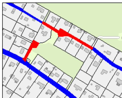
Hallonstigen och Älgstigen