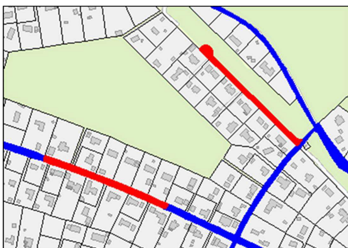
Kraftvägen och Myrvägen